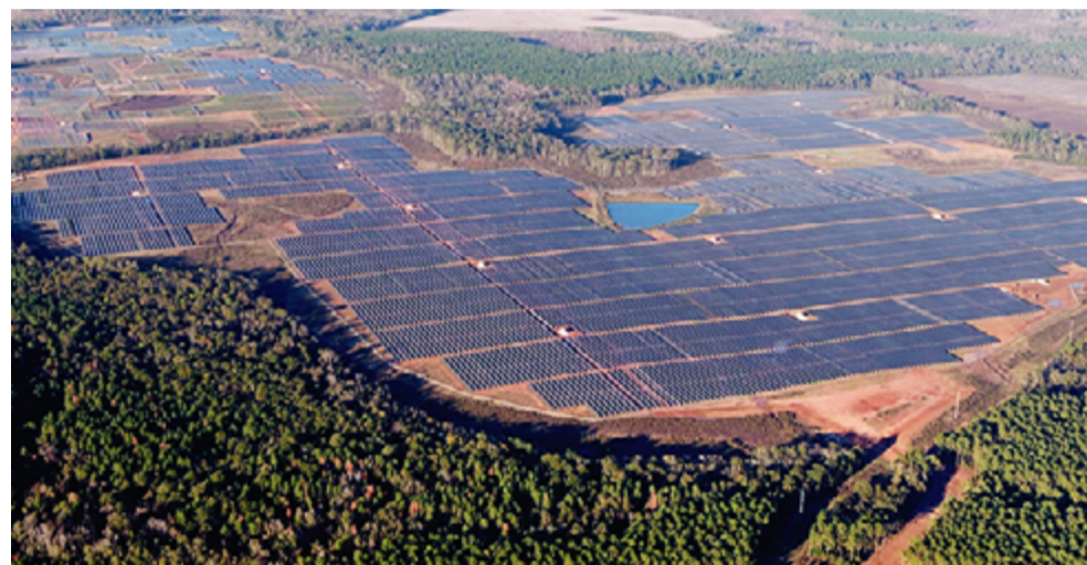
102.5-MW太阳能发电厂为Facebook在美国乔治亚州的第九个数据中心供电

此外，韩华正进行一项重要的收购，以使其能够为GE和美国普惠公司(P&W)等客户提供更好的服务，从而进入美国航空航天业。韩华产品也正在成为美国安防监控市场的中流砥柱，凭借其先进的能力赢得了众多备受尊敬的安防机构的奖项。此外，韩华是领先的工业机械和零部件制造商，提供空气和气体压缩机以及高精度轴承系统等产品。