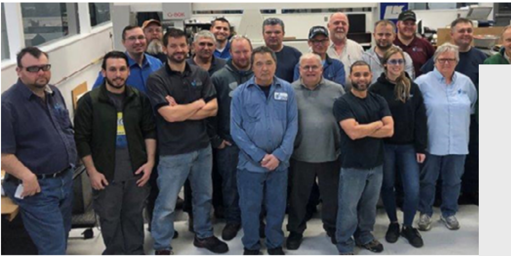
韩华Aerospace美国法人的团队成员为GE和美国普惠(P&W)等制造商开发和生产尖端飞机发动机部件。

韩华Aerospace 开发和生产先进的航空发动机部件，并于2019年收购EDAC技术公司，成立了韩华Aerospace美国法人。公司在康涅狄格州设有四个最先进的工厂，专门开发和生产飞机发动机零部件，如发动机整流罩和整体叶片式转子。韩华Aerospace美国法人，因其精心的质量管理，于2021年初获得了世界著名航空发动机制造企业——普惠公司的认可，获得了普惠供应商“黄金”认证。