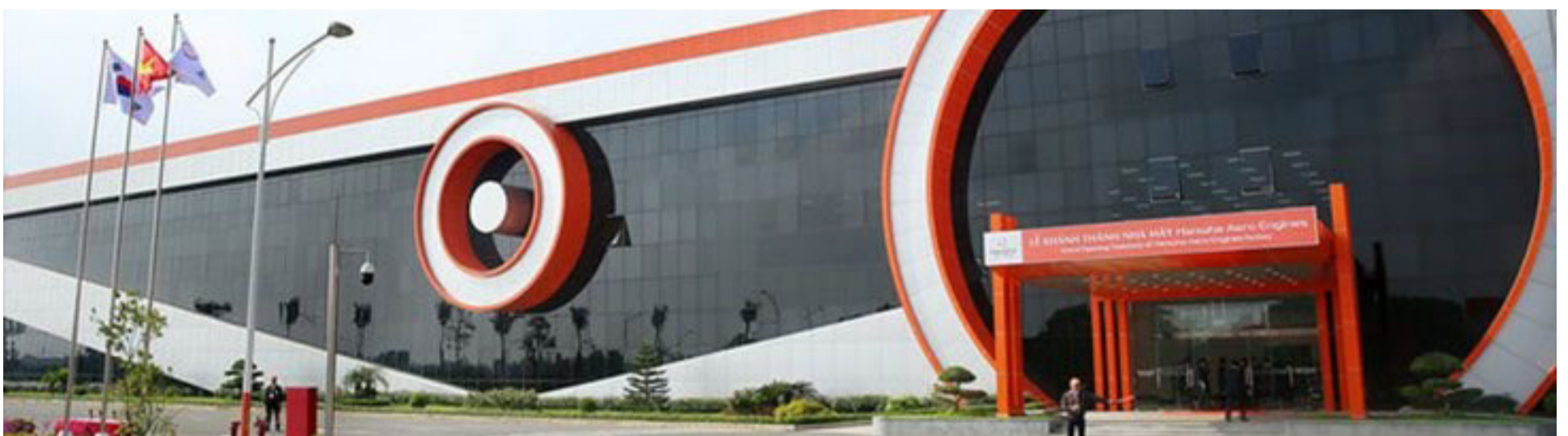
越南河内市的韩华航空发动机公司

韩华Aerospace 开发和生产先进飞机发动机部件，在河内市附近开设了一家飞机发动机部件工厂，以满足GE航空、美国普惠(P&W)和罗尔斯·罗伊斯 等公司日益增长的需求。这个10万平方米的工厂依托公司所拥有的技术和经验，大量生产高质量的飞机发动机部件。