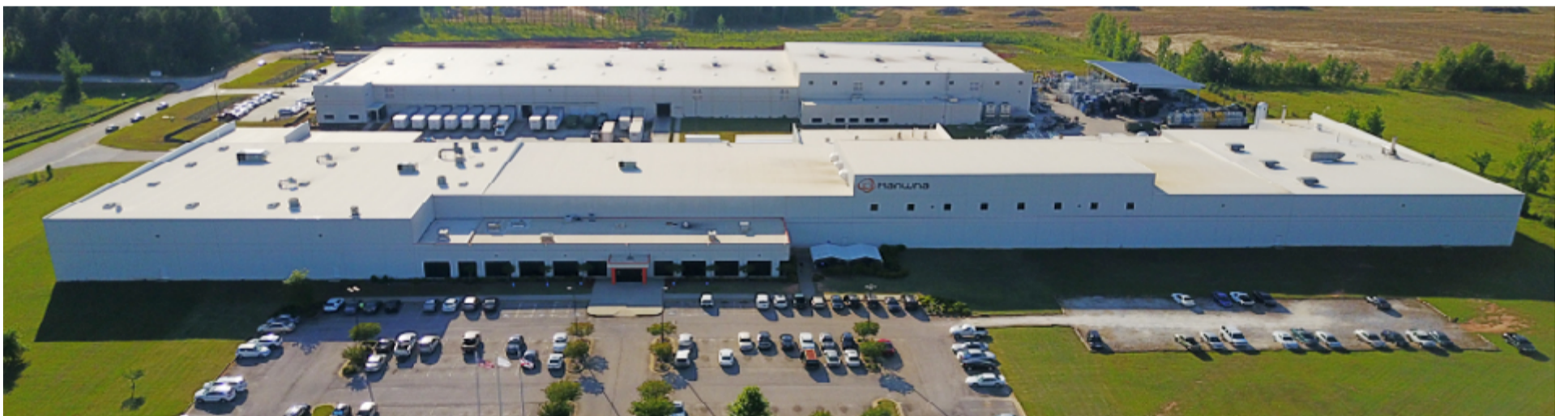
韩华高新材料美国

韩华思路信高新材料部门 及 韩华Azdel 开发、生产各式各样的增强热塑性汽车零部件。前者在增强热塑性复合材料(GMT)中排名世界第一，而后者在轻质增强热塑性复合材料(LWRT)生产和销售方面居世界第一。使用这些材料，可以生产更坚固、更安全的汽车，也可以减轻车辆重量，降低油耗，减少碳排放，保护环境。