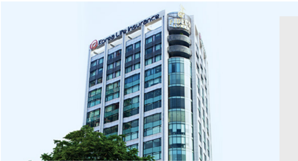
韩华生命保险越南在胡志明市的总部

越南拥有庞大的劳动力和友好的宜商环境，是韩华全球业务的关键。韩华生命在越南进行大量投资，并不断扩大业务，成为越南最大的保险公司之一。同时，还在越南资产管理和证券业开展业务。越南是韩华的制造中心，拥有专门的制造设施，生产最先进的飞机发动机部件和尖端视频监控解决方案。此外，通过太阳能和液化天然气(LNG)发电，韩华正在帮助越南减少对化石燃料的依赖。