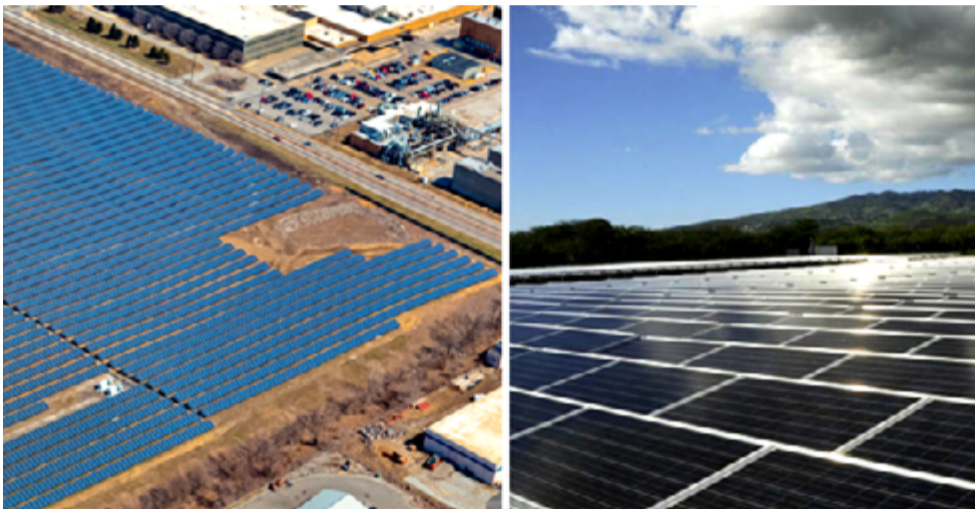
印第安纳波利斯的10.86-MW梅伍德太阳能发电厂(左) 美国夏威夷的5-MW Kalaheo可再生能源公园(右)

在美国市场前景十分广阔，韩华于1982年首次进军了美国市场，作为重要市场参与者，生产、销售和支持多种产品，包括太阳能发电系统解决方案、航空发动机、汽车零部件、工业设备、安防系统和石化产品。韩华正致力于进一步拓展在美国的业务，重点是颠覆性高科技、可持续发展企业以、金融和创业孵化业务。