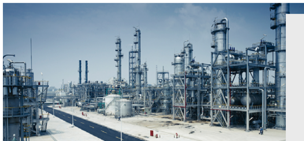
韩华思路信化学部门在中国宁波的工厂

中国在韩华的全球业务中占据重要地位。在华韩华炼油厂、石油化工厂的原材料出口到世界各地，其他工厂生产太阳能产品和轻质复合材料。韩华还生产工业机械和高精度芯片贴片机。除制造业之外，韩华生命保险是中国最大的外国保险公司之一，所提供的多种产品和服务，不断满足客户广泛的需求。