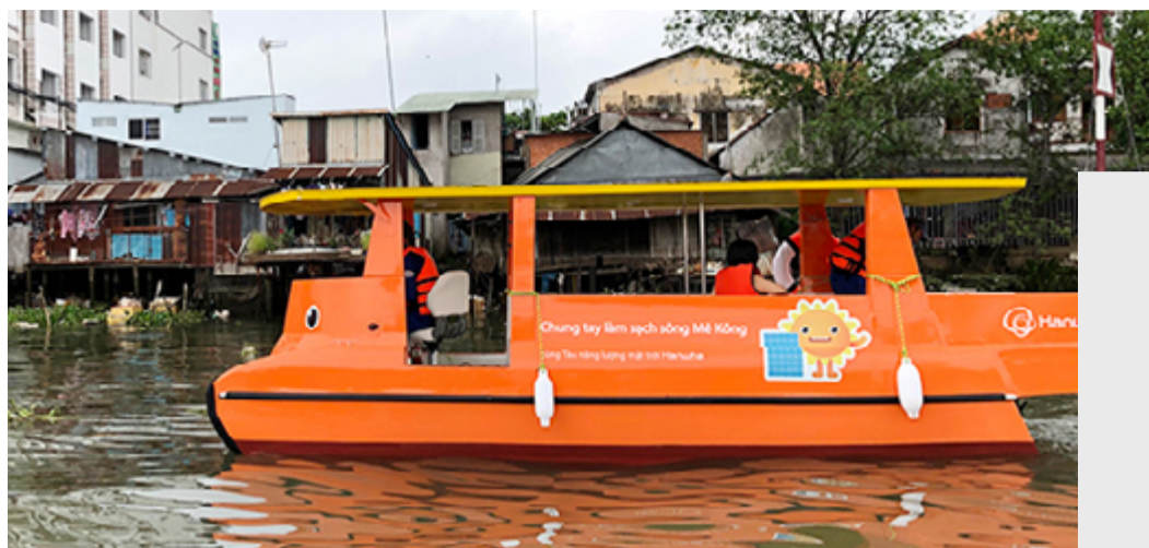
作为“清洁湄公河(Clean Up Mekong)”运动的一部分，向越南捐赠了一艘太阳能船

保险卡，让他们能够在政府医院接受治疗。此外，韩华还在贫困地区建立了免费诊所，让当地居民就近可以就医。鉴于此，韩华荣获了胡志明市人民委员会和资助贫困患者协会的表彰。