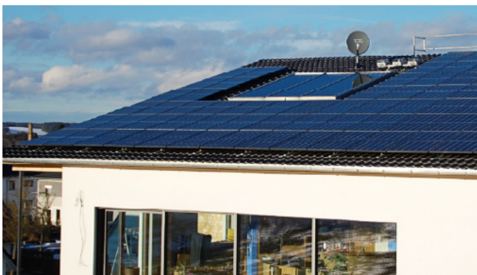
2019年3月，这座由Q CELLS位于德国奥格斯堡的太阳能板供电的房屋因其通过生态友好型建筑实现碳中和而获得了德国联邦经济技术部的联邦杰出创新成就奖。

韩华欧洲 是韩华设于欧洲大陆的枢纽。韩华欧洲的总部设在德国，为光伏产品、化工产品、高精密工业机械、汽车零部件和农业机械的进出口发挥纽带作用。