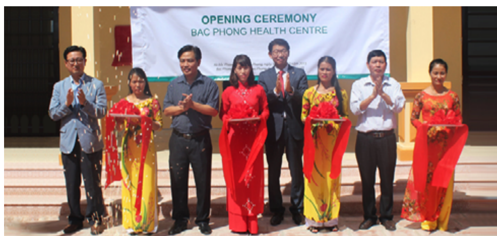
越南韩华生命保险公司捐赠兴建公共卫生中心在越南高峰市隆重开业

韩华Power Systems 为全球客户设计、制造涡轮机械。其产品包括工业用空气压缩机、电厂用燃气压缩机、液化天然气接收站用BOG(闪蒸汽、Boil Off Gas)压缩机等产品。公司还开发了涡轮增压器、超临界二氧化碳(sCO2)发动机、氧燃料燃气轮机等提升发电效率的技术。