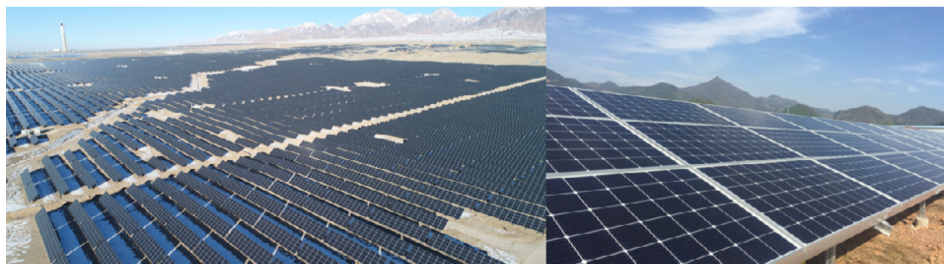
安装在青海省和铜山县的韩华思路信Q CELLS部门Q. Peak光伏组件

韩华思路信Q CELLS部门 是一家能源解决方案供应商，在江苏省启东市的工厂生产光伏产品。自2010年收购以来，启东工厂年产能几乎翻了两番，从1.3吉瓦增至5吉瓦，对公司成为全球领先的光伏解决方案供应商发挥重要贡献。